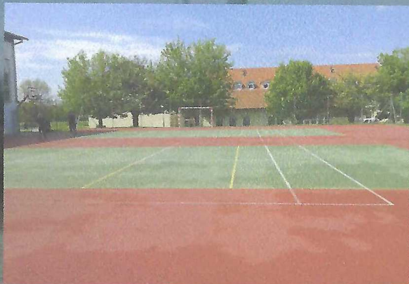
Původní víceúčel.hřiště s EPDM tartanem